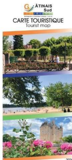
La carte touristique du Gâtinais Sud