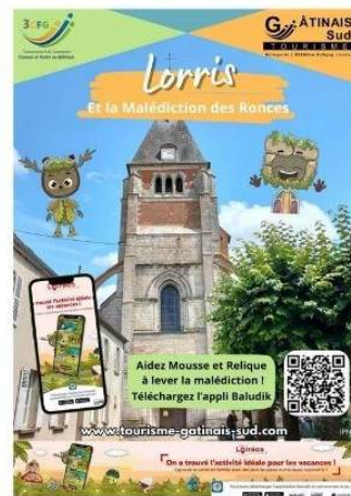
Jeu de piste : Baludik